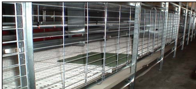
Kaiola aberastuak (ez ohikoak)

Honako hauek dira ohiko kaiolaren (aberastu gabeak) eta kaiola aberastuaren (ez ohikoak) arteko aldeak: kaiola aberastuetan oilo bakoitzak leku gehiago du eta barruan ekipamendu handiagoak dituzte. Kaiola aberastuek, besteak beste, habia eta kota, alegia, oiloak igotzeko katea izaten dituzte. Horiek lagundu egiten diote oiloei euren jarrera etologikoa garatzen.